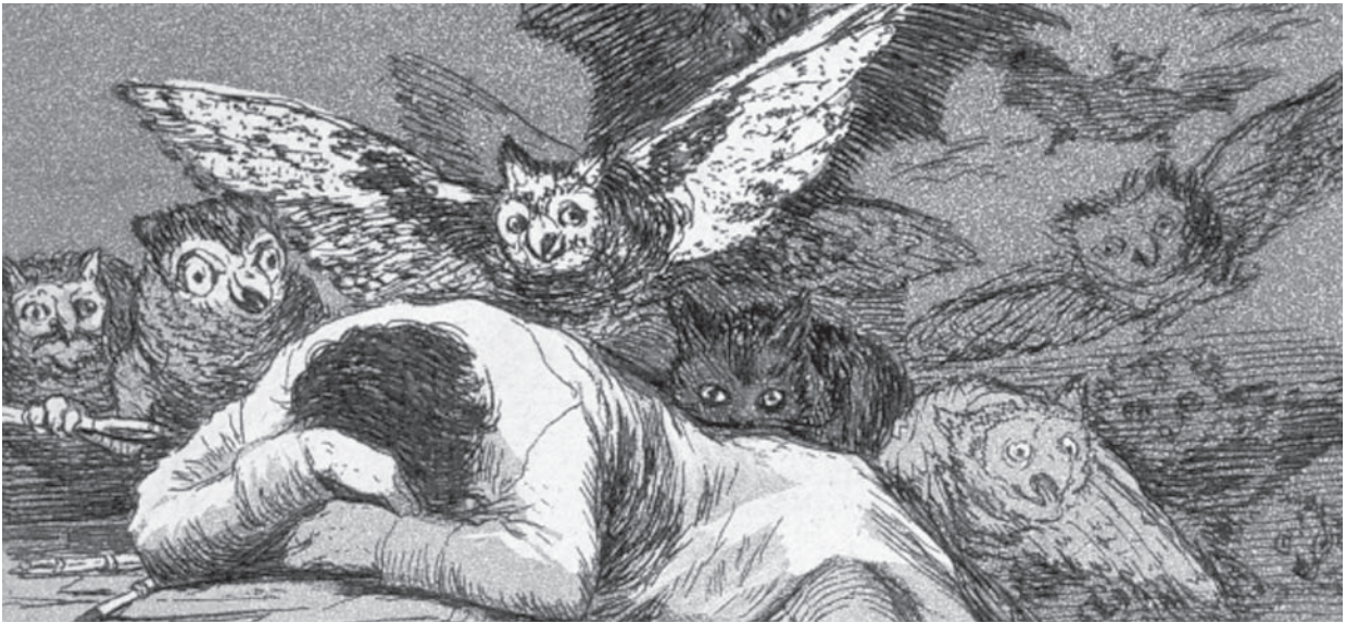
Francisco José de Goya y Lucientes: Der Schlaf der Vernunft gebiert Ungeheuer, 1799.

und Entfaltung der Kreatur. Im bestiarium der neuen deutschen Universität ist die Kreatur das Element, das das ideologische Telos des unbedingten Nutzens am reinsten verkörpert. Geschaffen, um zu helfen, wächst es zum Wächter der Interessen der Institution, die es vertritt, heran. Der Wächter aber ist unerbittlich. Er gleicht zuweilen den grotesken Figuren, die sich an den Pforten des Hades lagern, oder den Erinnyen, die die Schwelle zum Hause des Muttermörders besetzen. Mitleidlos walten sie ihres Amtes und setzen »das Recht« auch dann und auch dort durch, wo sein Vollzug höchstes Unrecht schafft ( summum ius summa iniuria ).